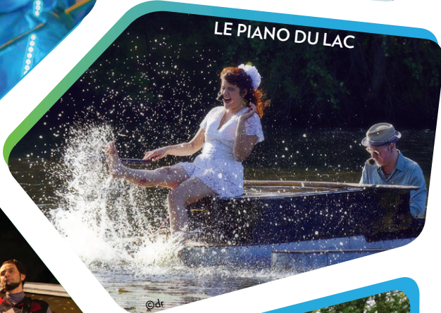
LE PIANO DU LAC