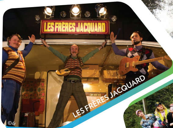
LES FRÈRES JACQUARD