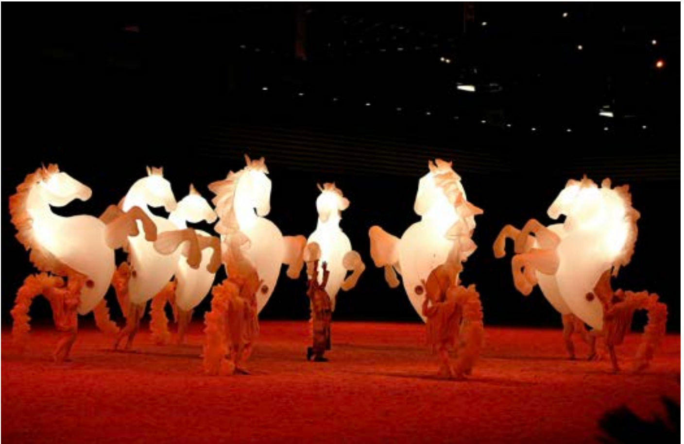
Les Quidams, Fiers à cheval

L'intérêt majeur que présentent les propositions artistiques soigneusement sélectionnées par l'équipe de l'Atelier à spectacle, en dehors de leur caractère spectaculaire et accessible, c'est leur poésie, leur inventivité, leur réception et la multiplicité des possibles quant à l'adresse aux publics.