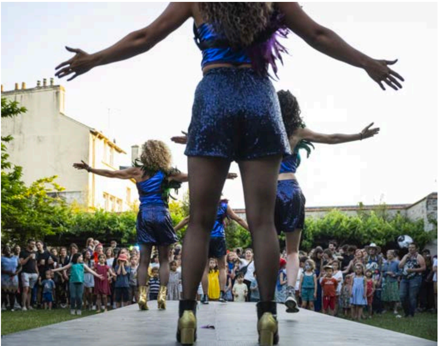
Group Berthe, Superbe(s)

Le projet artistique et culturel du festival de territoire de l'Agglo du Pays de Dreux est fondé sur le principe des droits culturels.