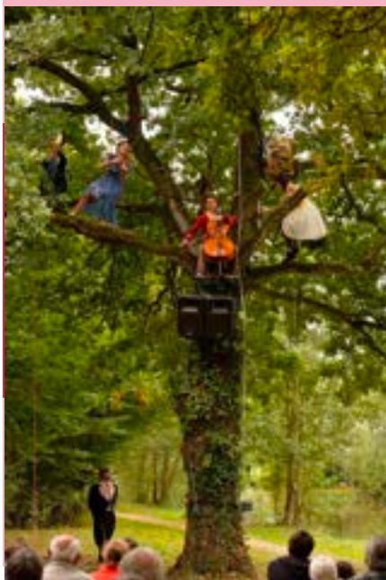
Le Concerto Perché