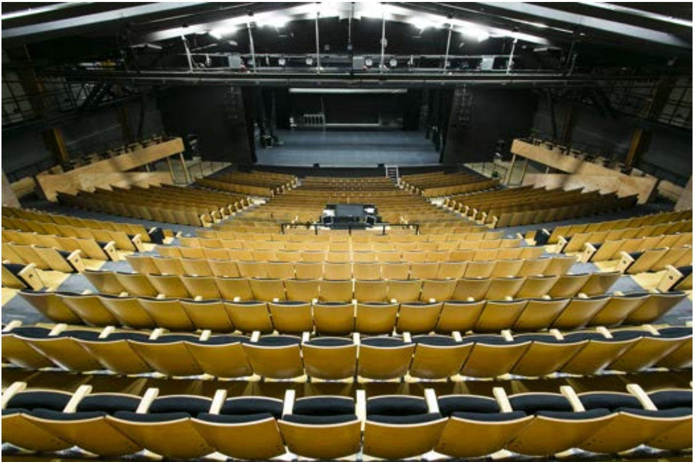
L'Atelier - salle de 954 places

Créé par l'Atelier à spectacle, un équipement de l'Agglo du Pays de Dreux