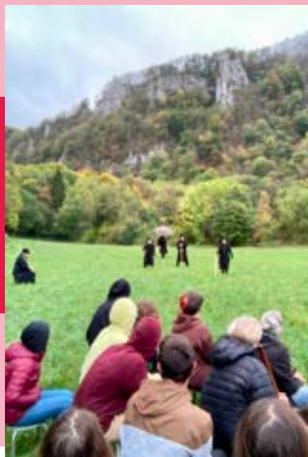
Une saison en enfer